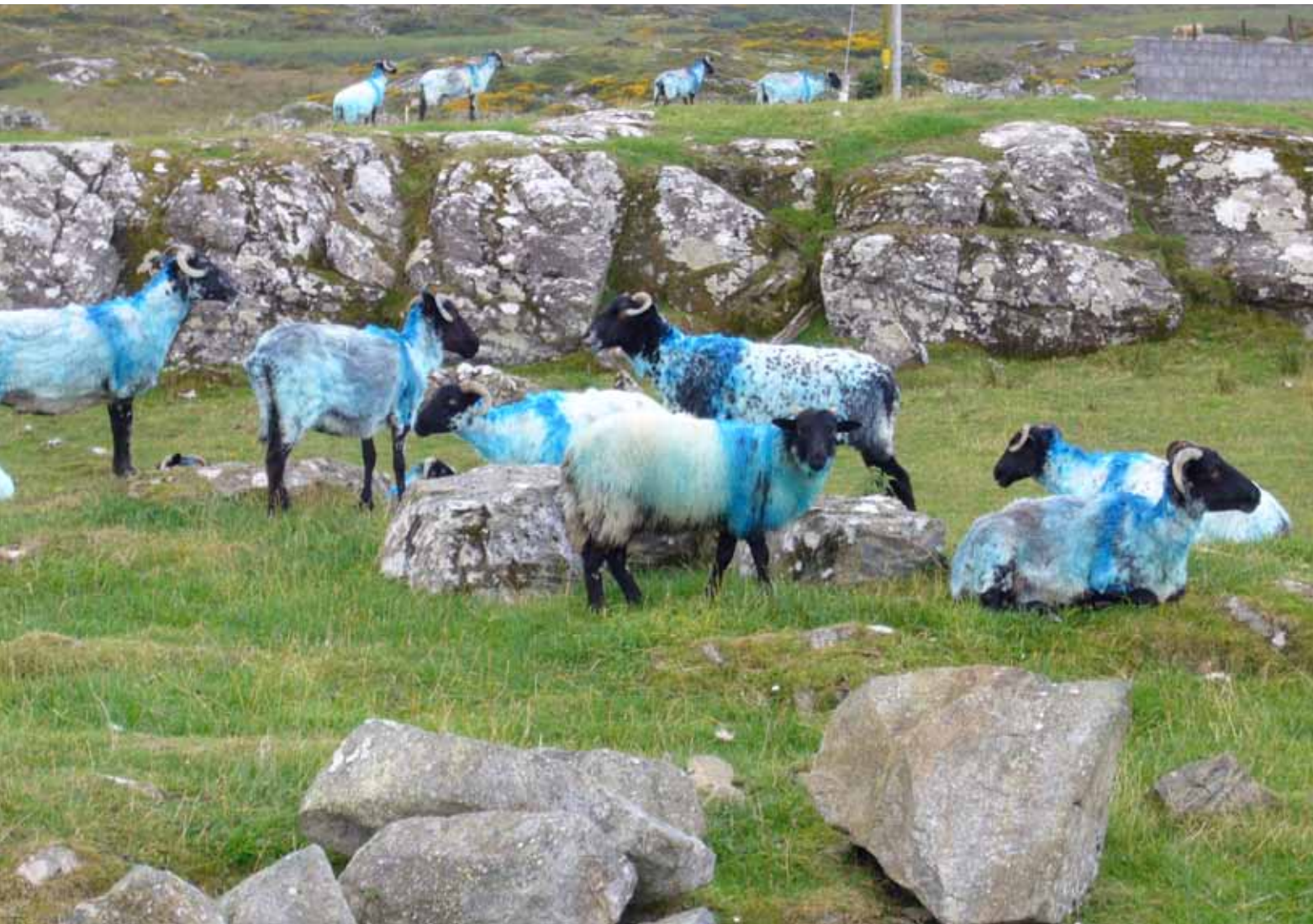
Photo et devinette envoyées par Pierre, 7 ans (Morvan). La réponse se trouve en page 4

Envoyez-nous vos textes, vos dessins, des photos de vos sculptures, modelages, masques, machines extraordinaires, gâteaux, cabanes, plantations, récoltes, mobiles, instruments de musique, etc. Vous pouvez le faire par mail ou par la poste, à l'adresse L'Ecole Vivante, 290 Chemin de Saint-Jean Le Puy d'Auberge, 83560 La Verdière.